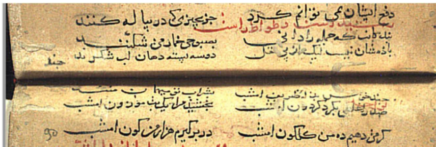
دست‌نویس توفیق یحیی

اشعار و ضبط‌های آن محل تردید است و بسیاری از اشعار دیگر شعرا که در این دیوان در ذیل نام وطواط و در شمار اشعار او نقل شده‌اند؛ از تصحیفات و تحریفات فراوان دیوان که بگذریم آنچه ضعف جدی دیوان مصحح نفیسی به شمار می‌رود و تاکنون ذکری از آن نرفته است، افتادن ابیات بسیاری از رشیدالدین وطواط است. این ابیات گاه اشعار کاملی هستند که به‌طور کامل از دیوان فوت شده‌اند و گاهی ابیاتی‌اند که از خلال اشعار افتاده و گاه بیت‌های پراکنده‌ای از وطواط‌اند که عمدتاً در سفینه‌های کهن مضبوط هستند. در این پژوهش ۷۵ بیت نویافته از رشیدالدین وطواط بر پایه هفده نسخه خطی و چهار سفینه کهن معرفی شد که این ابیات به‌جز ابیات فوت‌شده از خلال اشعار، شامل یک قصیده کامل، چهار قطعه، دو رباعی و ده بیت پراکنده می‌شود.