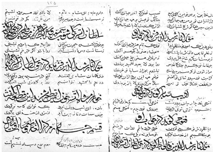
دست‌نویس سفینه ترمذ